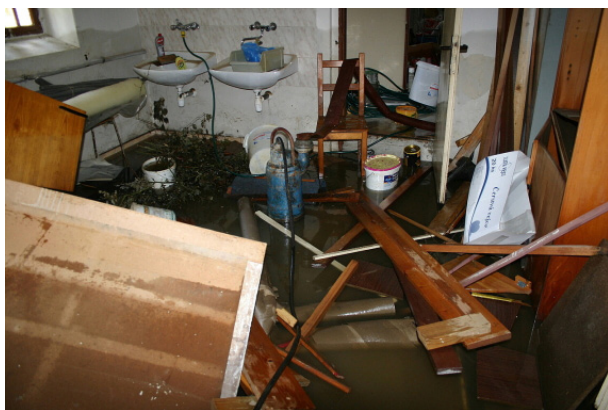
Zatopený sborový dům v Chrastavě